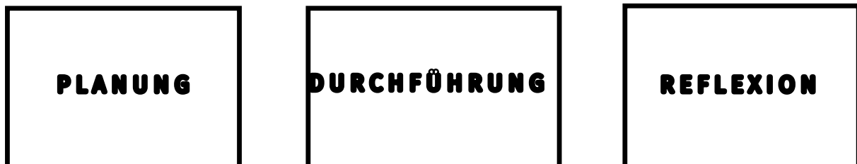
Abbildung 1: Zeitpunkte der Betrachtung von schwierigen Situationen.

Schwierige Lehrsituationen können sowohl bei der Vorbereitung, bei der Durchführung als auch bei der Nachbereitung (Reflexion) betrachtet werden, wie Abbildung 1 veranschaulicht. Solche Situationen bei der Vorbereitung „mitzudenken“, kann Ihnen helfen, sich darauf einzustellen und besser damit umgehen zu können. Die nachträgliche Reflexion bietet die Gelegenheit, sich im kollegialen Austausch oder in der Beratung zu entlasten und Alternativen zu gewinnen. Schwierige Lehrsituationen gilt es wahrzunehmen, sie zu verstehen, Handlungsmöglichkeiten und Interventionen zu kennen und angemessen einsetzen zu können sowie Schwierigkeiten immer wieder zu reflektieren und daraus zu lernen.