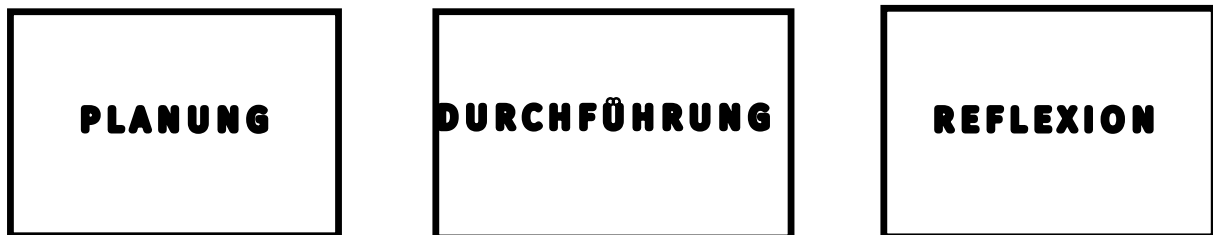
Abbildung 1: Zeitpunkte der Betrachtung von schwierigen Situationen. Quelle: Schumacher 2022, S. 15

Schwierige Lehrsituationen können sowohl bei der Vorbereitung, bei der Durchführung als auch bei der Nachbereitung (Reflexion) betrachtet werden, wie Abbildung 1 veranschaulicht. Solche Situationen bei der Vorbereitung „mitzudenken“, kann Ihnen helfen, sich darauf einzustellen und besser damit umgehen zu können. Die nachträgliche Reflexion bietet die Gelegenheit, sich im kollegialen Austausch oder in der Beratung zu entlasten und Alternativen zu gewinnen. Schwierige Lehrsituationen gilt es wahrzunehmen, sie zu verstehen, Handlungsmöglichkeiten und Interventionen zu kennen und angemessen einsetzen zu können sowie Schwierigkeiten immer wieder zu reflektieren und daraus zu lernen.