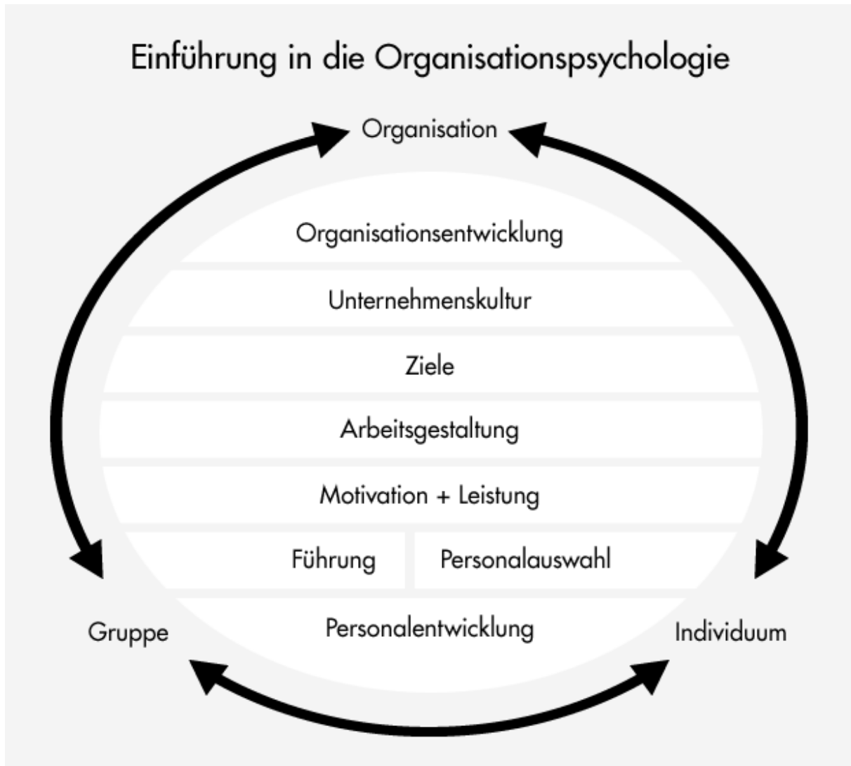
Abbildung: Beispiel für eine grafische Themenübersicht zur Organisationspsychologie

Vorkenntnisse der Studierenden aktiviert, ihr Interesse erhöht und eine erste Orientierung im Thema ermöglicht.