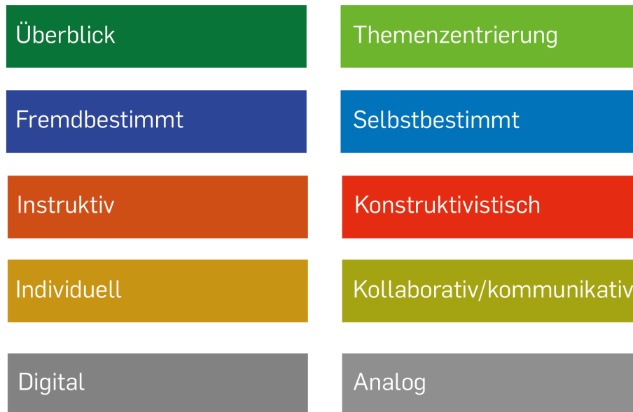
Abb. 2: Gegenüberstellung unterschiedlicher Gestaltungsmöglichkeiten von Exkursionen

Beispielhaft seien hier einige ausführlicher vorgestellt: