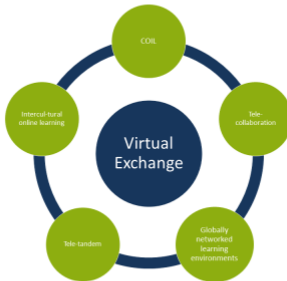
Abbildung 1: Der Begriff Virtual Exchange führt viele Begriffe zusammen.

Vor dem Hintergrund der COVID-19 Pandemie haben sich Virtual Exchange Angebote ausgebreitet wie nie zuvor (z.B. Rubin 2022, S. 3-4; UNICollaboration 2023; Stevens Initiative 2023). Die verstärkte Nutzung digitaler Instrumente führte zu Alternativen zum bis dahin vorherrschenden Präsenzunterricht. Dies gilt auch für Internationalisierungsaktivitäten, die vor der Pandemie vor allem mit Reisen und Auslandsaufenthalten verbunden waren.