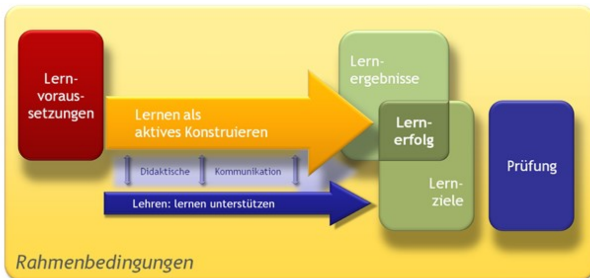
Abbildung 1.1: Konstruktivistisches lernzielorientiertes Lehr-Lernverständnis.