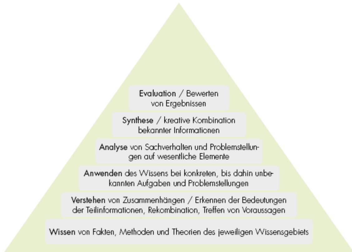
Abbildung: Schematische Darstellung der kognitiven Lernzieltaxonomie