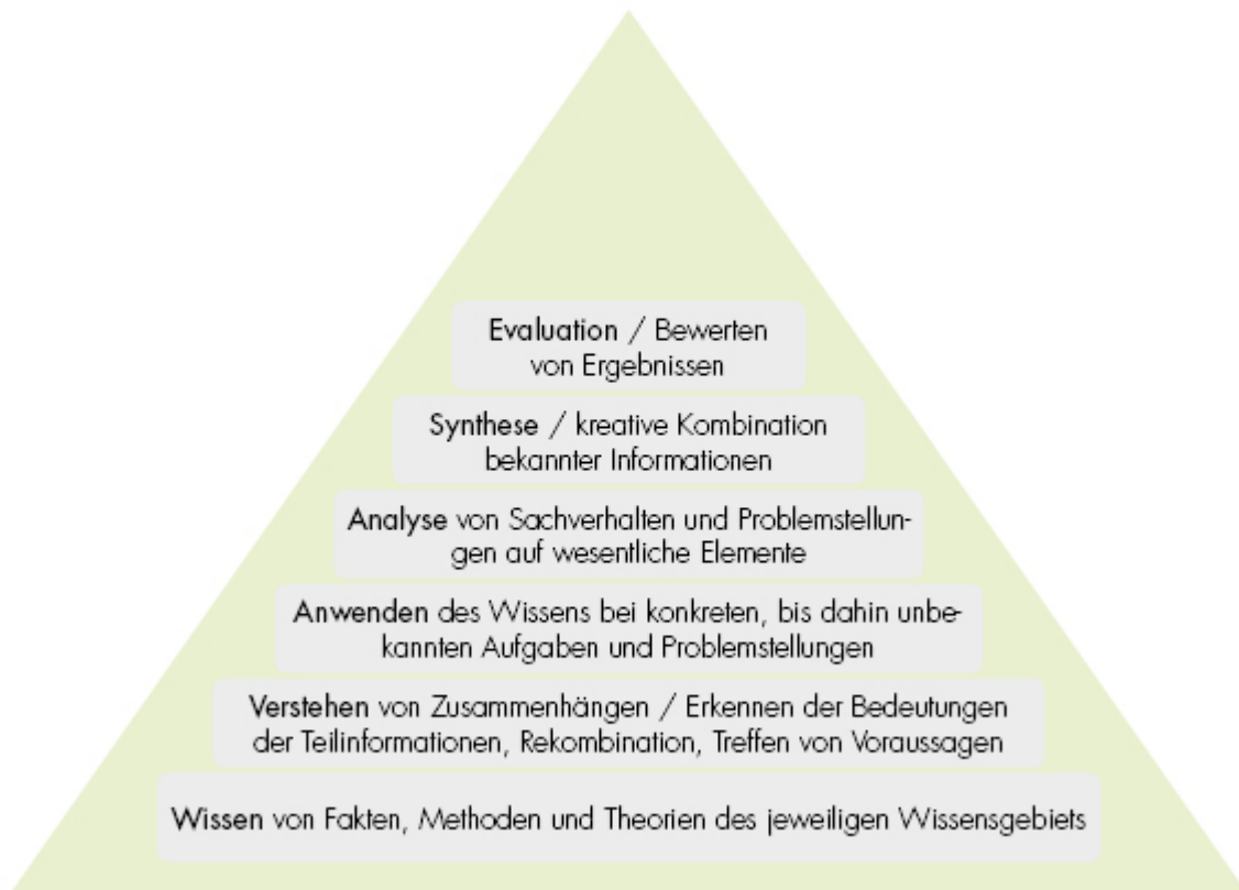
Abbildung: Schematische Darstellung der kognitiven Lernzieltaxonomie